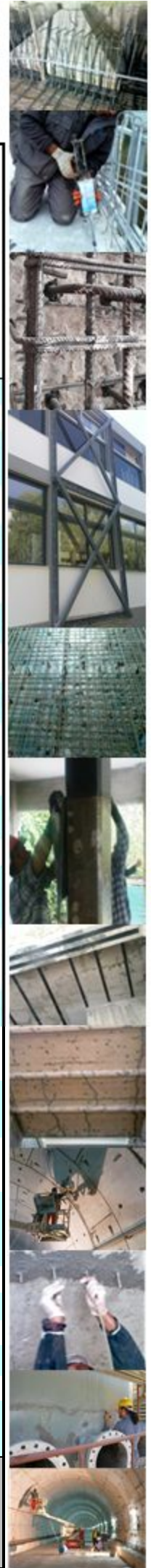
Τύπος ενδεδειγμένος για χρήση κυρίως κατά τη νθηρινή περίοδο ☑

Επισκευή Ρηγματώσεων σε Σκυρόδεμα Τοπικές Επισκευές/ Στοκαρίσματα σε Σκυρόδεμα (για εσωτερική και/ή εξωτερική χρήση) Σύστημα τύπου beton-contact Πακτώσεις - Αγκυρώσεις (αγκύρια - βλήτρα - ντιζες) Rigid Bonding Ενισχύσεις με συστήματα τύπου Βετον-plaques και/ή μεθοδολογία κλωβού Ενισχύσεις με συστήματα ΙΟΠ/ FRPs Αστάρωμα Δαπέδων Ρητινοκονίαμα